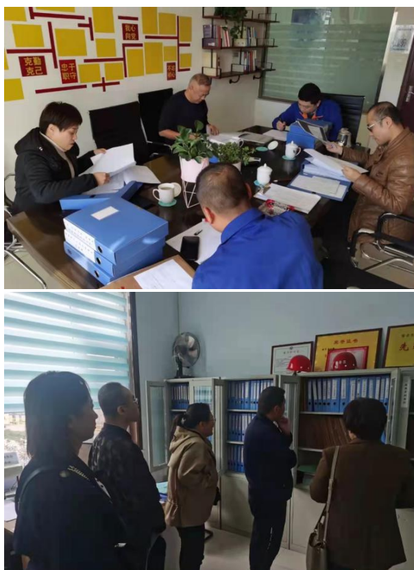
职业健康专家赴企业指导企业制度建设