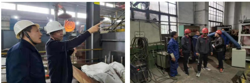
职业健康技术专家到用人单位对健康企业技术工艺进行指导