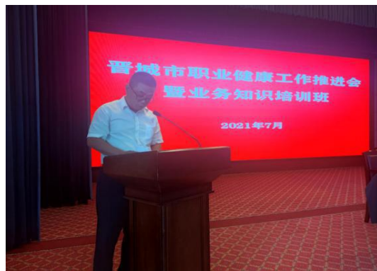
召开职业健康推进会，安排优秀单位交流发言

纲举则目张，本立而道生。晋城市卫生健康委重宣传增意识、建制度强管理、抓关键提保障、搭平台促交流多措并举，为全市用人单位积极参与建设健康企业提供了良好机遇。