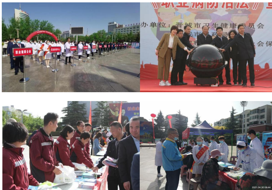
2021 年《职业病防治法》宣传周启动仪式、咨询义诊活动

次，印发放宣传资料 163816 份，宣传活动覆盖人数达 15.2 万余人，评选市级“健康达人” 59 名，推荐上报省级“健康达人” 10 名，为进一步营造全民职业健康意识和维护广大劳动者合法健康权益营造了良好社会氛围。