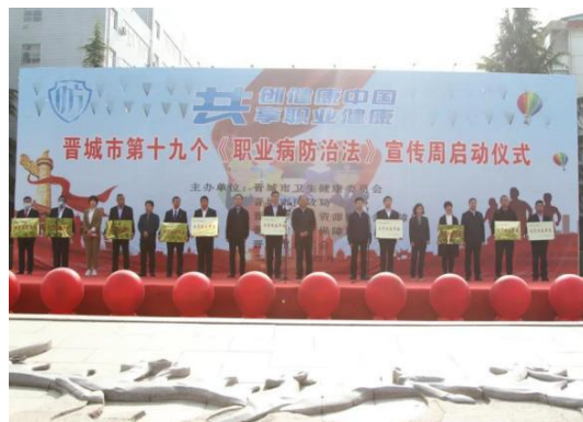
举办职业健康培训班解读健康企业知识、宣传周启动仪式为健康企业领奖